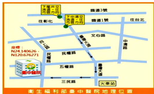
衛生福利部臺中醫院地理位置圖