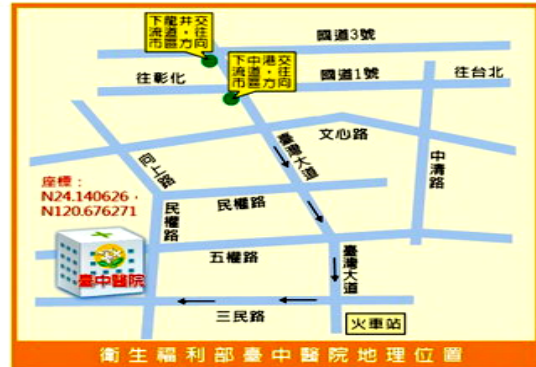
衛生福利部臺中醫院地理位置圖